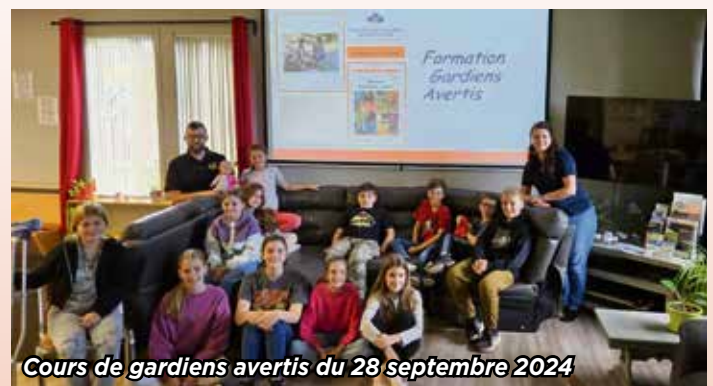
Cours de gardiens avertis du 28 septembre 2024