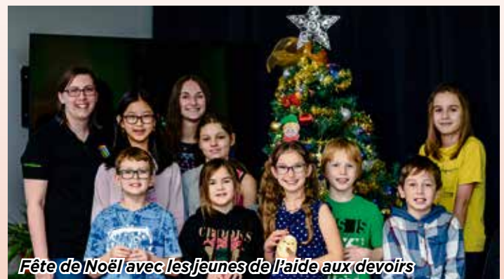
Fête de Noël avec les jeunes de l'aide aux devoirs