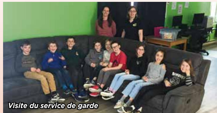
Visite du service de garde