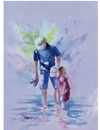
« Tu vois mes pieds ! », Photo courtoisie d'Andrée Alexandre.